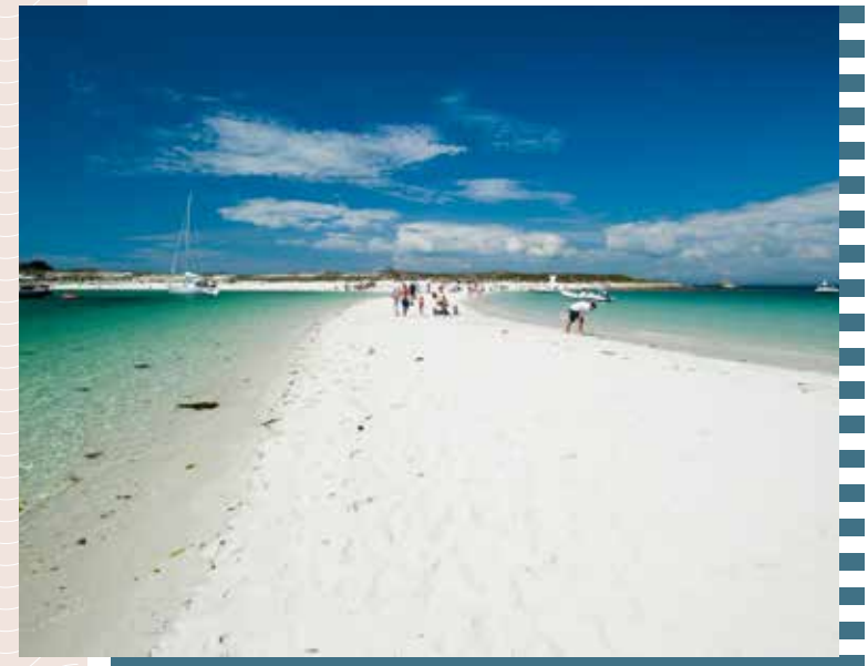
ARCHIPEL DES GLÉNAN

THE LEGENDARY CORNOUAILLE - A FULL BRITTANY EXPERIENCE WHILE FACING THE GLENAN ARCHIPELAGO