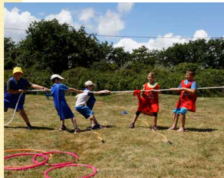
CLUB ENFANTS MISTER FLOWER (5 - 12 ANS)

Some holidays at le Domaine de Pendruc ? the kids will love that, fun and challenge are the new motto for their holidays. It is family's paradise. In July and August, the best place to make some friends : "the kid's club Mister Flower". They also can enjoy the wooden playground, the sport ground and a zipline ride.