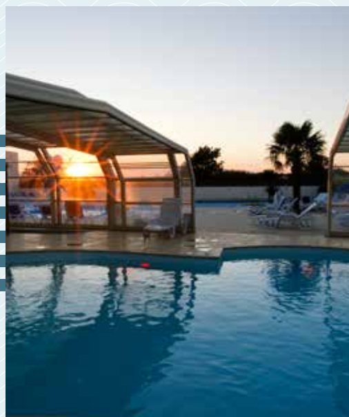
PISCINE COUVERTE ET CHAUFFÉE