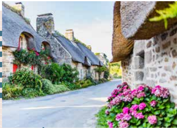
CHAUMIÈRES DE KERASCOËT